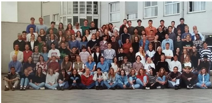
Mavo4 examenjaar 1995

Heb jij je nog niet aangemeld en ben je wel van plan naar de reünie te komen? Wacht dan niet te lang meer. In verband met alle voorbereidingen en bestellingen sluiten we kort na de zomervakantie de inschrijving!