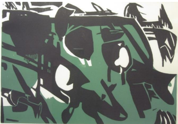
Jan van der Zee: houtsnede 1964, titel onbekend