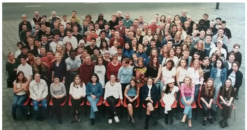
Examenjaar 2002 vbo4

Tot nu toe zijn er naar verhouding weinig aanmeldingen binnen van oud-leerlingen van na 1991 en van het vmbo en de praktijkschool vanaf 1998. We gaan er van uit dat ook deze jongere categorie oud-leerlingen zich nog volop gaat aanmelden. We horen vaak van jongere oud WP-ers: "Aanmelden voor de reünie? Ja, dat moet ik nog doen. Dat is in oktober hè? Ach dat kan nog wel." Inderdaad nu nog wel, maar er komt een moment dat we de inschrijving absoluut moeten sluiten. Elke maandag is er op www.wp150.nl en actuele lijst met namen van alle aangemelde reünisten. Wacht niet op een ander. Als jij je hebt ingeschreven, volgen er zeker meer. Het programma biedt voor elk wat wils.