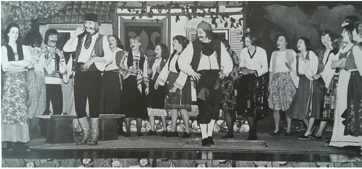
Opvoering 'Ezels van Gacka' 1975

Het is druk op FB150; er zijn veel volgers en veel oud-leerlingen zoeken elkaar via deze weg. Hele klassen zijn intussen met elkaar in contact en melden zich als klas aan. Ook als je geen facebook account hebt, kun je de berichten over WP150 volgen, zij het iets beperkter. Wil je alle klassenfoto's, mooie herinneringen, nostalgische verhalen en reacties op FB niet missen? Ga dan naar www.wp150.nl en klik onderaan de homepage op de F van facebook en geniet!